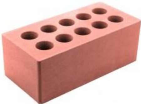
Красный кирпич Гладкий 250x120x88 мм. 252 шт. в поддоне