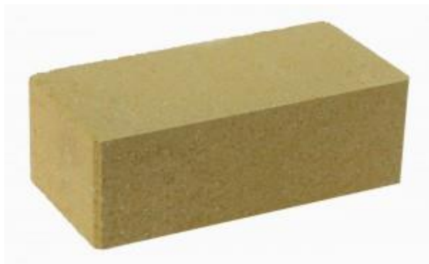
Горчичный кирпич Гладкий 250x120x88 мм. 252 шт. в поддоне

Ниже представлены разные цветовые решения, имеющие одинаковые технические характеристики: