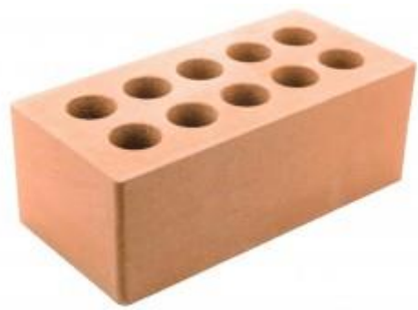
Персиковый кирпич Гладкий 250x120x88 мм. 252 шт. в поддоне