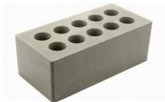
Серый кирпич Гладкий 250x120x88 мм. 252 шт. в поддоне