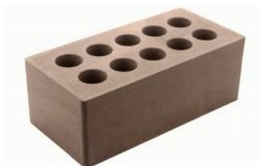
Коричневый кирпич Гладкий 250x120x88 мм. 252 шт. в поддоне