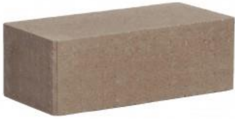
Молочный шоколад кирпич Гладкий 250x120x88 мм. 252 шт. в поддоне