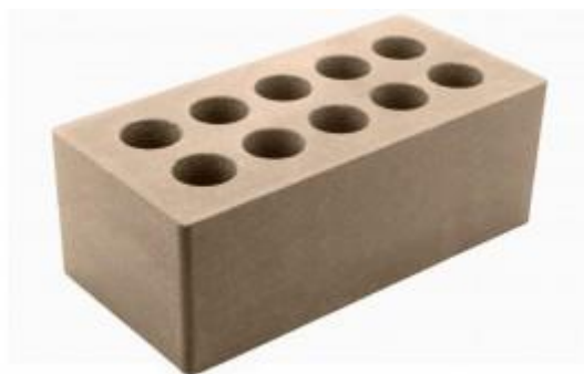
Молочный шоколад кирпич Гладкий 250x120x88 мм. 252 шт. в поддоне