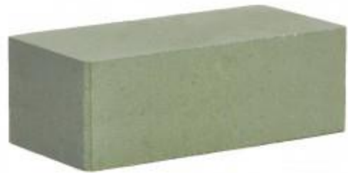
Зеленый кирпич Гладкий 250x120x88 мм. 252 шт. в поддоне