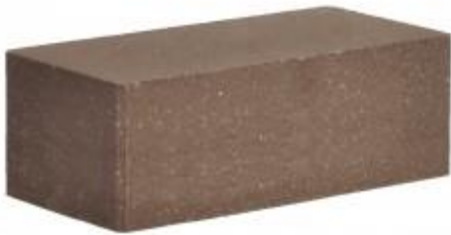
Коричневый кирпич Гладкий 250x120x88 мм. 252 шт. в поддоне