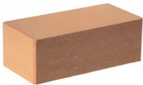
Персиковый кирпич Гладкий 250x120x88 мм. 252 шт. в поддоне