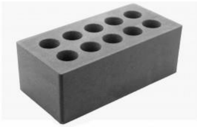
Черный кирпич Гладкий 250x120x88 мм. 252 шт. в поддоне