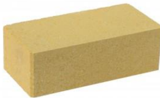
Желтый кирпич Гладкий 250x120x88 мм. 252 шт. в поддоне