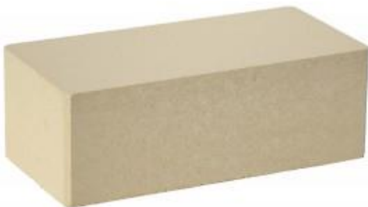
Слоновая кость Гладкий 250x120x88 мм. 252 шт. в поддоне