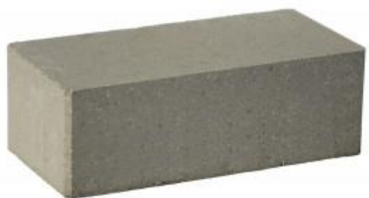
Серый кирпич Гладкий 250x120x88 мм. 252 шт. в поддоне