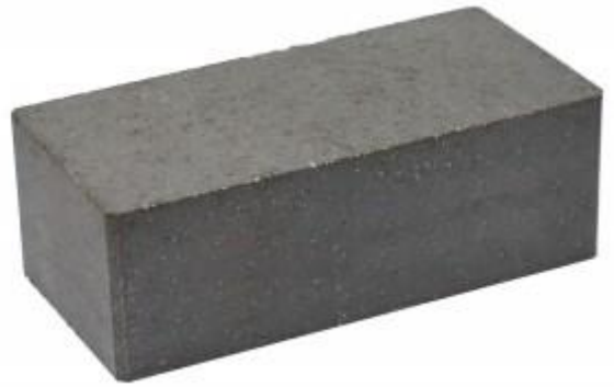
Черный кирпич Гладкий 250x120x88 мм. 252 шт. в поддоне