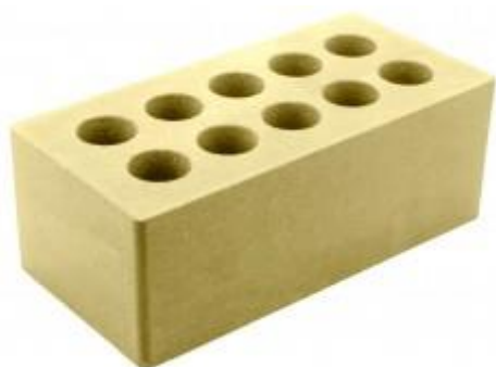
Горчичный кирпич Гладкий 250x120x88 мм. 252 шт. в поддоне