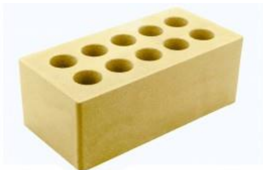
Желтый кирпич Гладкий 250x120x88 мм. 252 шт. в поддоне