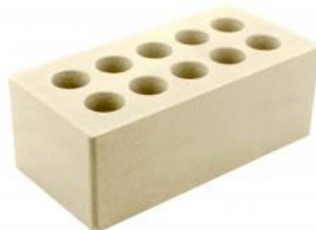
Слоновая кость Гладкий 250x120x88 мм. 252 шт. в поддоне