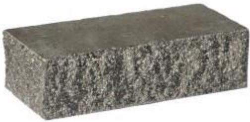
Черный кирпич Угловой 230x100x65 мм. 384 шт. в поддоне