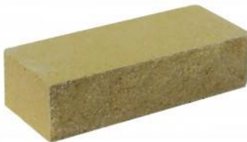
Горчичный кирпич Рифленый 250x95x65 мм. 432 шт. в поддоне