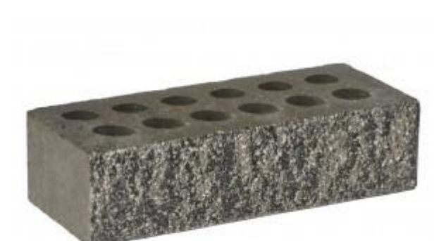
Черный кирпич Рифленый 250x95x65 мм. 432 шт. в поддоне