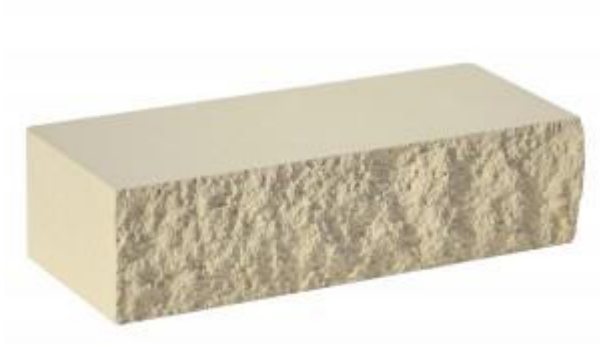
Слоновая кость Рифленый 250x95x65 мм. 432 шт. в поддоне