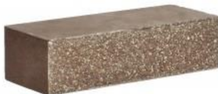
Коричневый кирпич Рифленый 250x95x65 мм. 432 шт. в поддоне