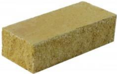
Горчичный кирпич Угловой 230x100x65 мм. 384 шт. в поддоне