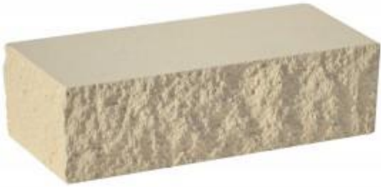
Слоновая кость Угловой 230x100x65 мм. 384 шт. в поддоне