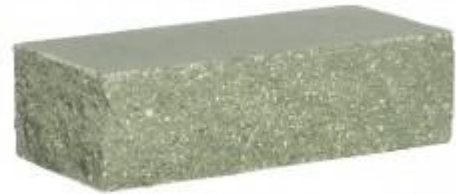
Зеленый кирпич Угловой 230x100x65 мм. 384 шт. в поддоне