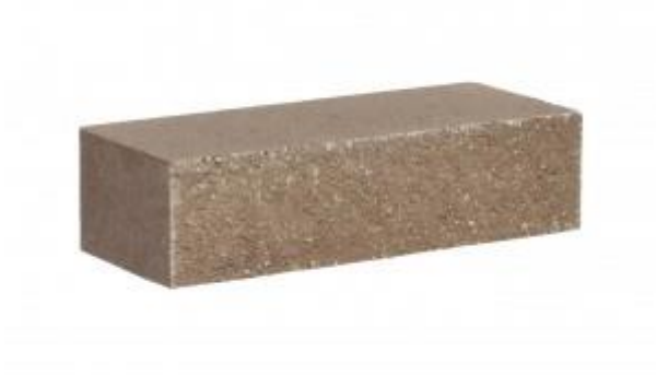
Молочный шоколад кирпич Рифленый 250x95x65 мм. 432 шт. в поддоне