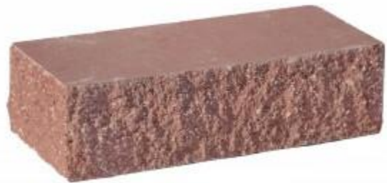
Красный кирпич Угловой 230x100x65 мм. 384 шт. в поддоне