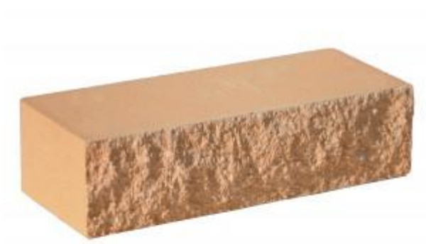
Персиковый кирпич Рифленый 250x95x65 мм. 432 шт. в поддоне