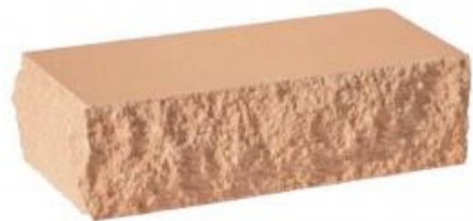
Персиковый кирпич Угловой 230x100x65 мм. 384 шт. в поддоне