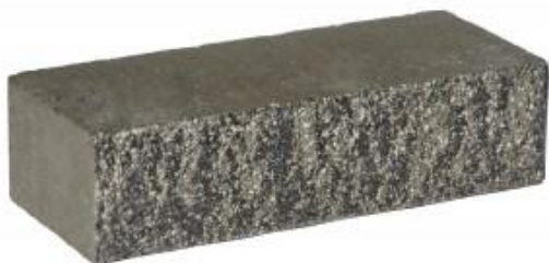
Черный кирпич Рифленый 250x95x65 мм. 432 шт. в поддоне

Ниже представлены разные цветовые решения, имеющие одинаковые технические характеристики: