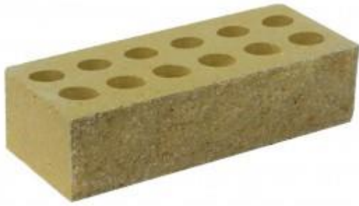
Горчичный кирпич Рифленый 250x95x65 мм. 432 шт. в поддоне