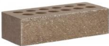
Молочный шоколад кирпич Рифленый 250x95x65 мм. 432 шт. в поддоне