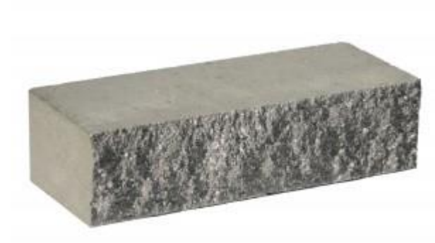
Серый кирпич Рифленый 250x95x65 мм. 432 шт. в поддоне