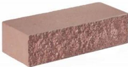
Красный кирпич Рифленый 250x95x65 мм. 432 шт. в поддоне