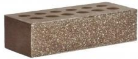
Коричневый кирпич Рифленый 250x95x65 мм. 432 шт. в поддоне