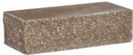
Коричневый кирпич Угловой 230x100x65 мм. 384 шт. в поддоне