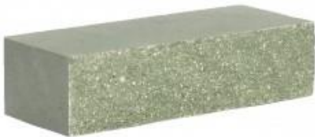
Зеленый кирпич Рифленый 250x95x65 мм. 432 шт. в поддоне