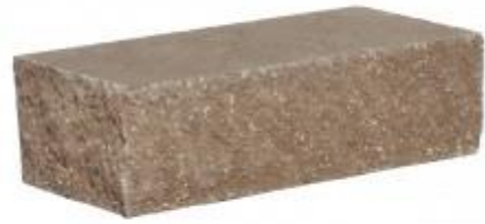
Молочный шоколад кирпич Угловой 230x100x65 мм. 384 шт. в поддоне