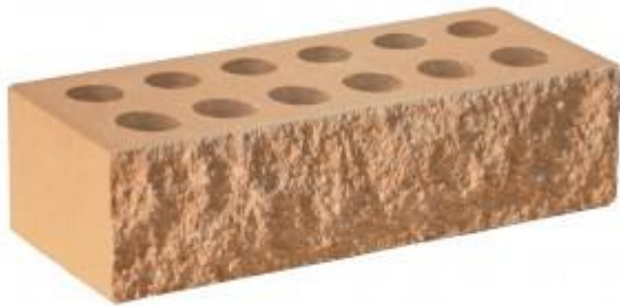
Персиковый кирпич Рифленый 250x95x65 мм. 432 шт. в поддоне