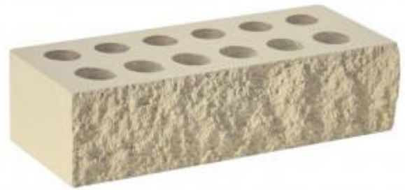
Слоновая кость Рифленый 250x95x65 мм. 432 шт. в поддоне