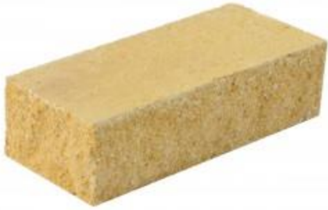
Желтый кирпич Угловой 230x100x65 мм. 384 шт. в поддоне