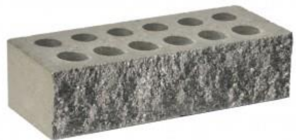
Серый кирпич Рифленый 250x95x65 мм. 432 шт. в поддоне