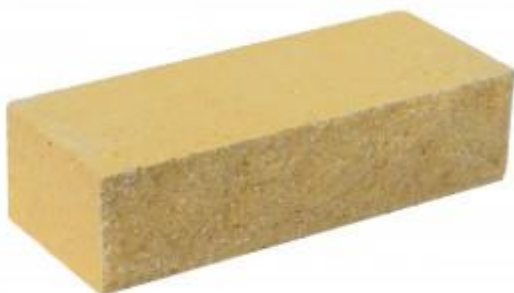
Желтый кирпич Рифленый 250x95x65 мм. 432 шт. в поддоне