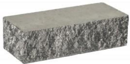
Серый кирпич Угловой 230x100x65 мм. 384 шт. в поддоне