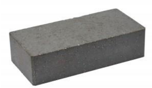
Черный кирпич Гладкий 250x120x65 мм. 336 шт. в поддоне