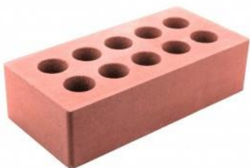
Красный кирпич Гладкий 250x120x65 мм. 336 шт. в поддоне