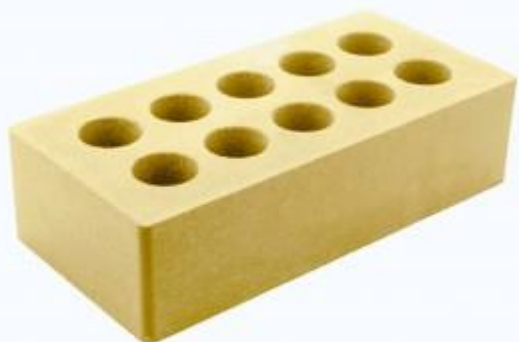
Желтый кирпич Гладкий 250x120x65 мм. 336 шт. в поддоне