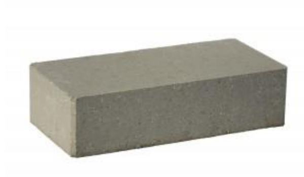
Серый кирпич Гладкий 250x120x65 мм. 336 шт. в поддоне