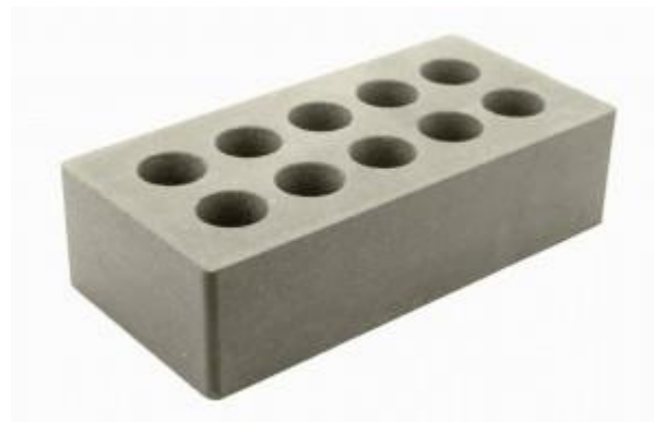
Серый кирпич Гладкий 250x120x65 мм. 336 шт. в поддоне