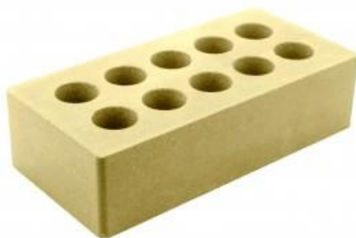
Горчичный кирпич Гладкий 250x120x65 мм. 336 шт. в поддоне