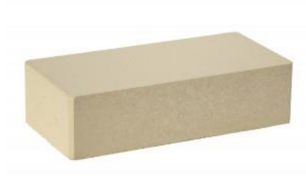
Слоновая кость Гладкий 250x120x65 мм. 336 шт. в поддоне