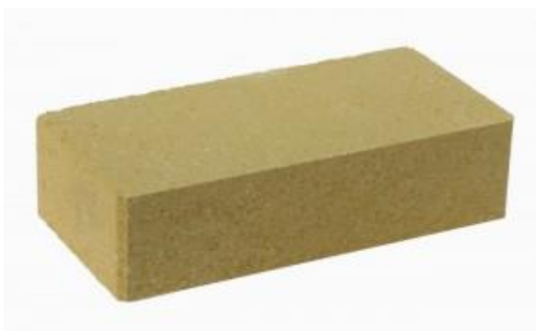
Горчичный кирпич Гладкий 250x120x65 мм. 336 шт. в поддоне