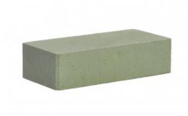
Зеленый кирпич Гладкий 250x120x65 мм. 336 шт. в поддоне