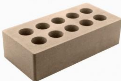
Молочный шоколад кирпич Гладкий 250x120x65 мм. 336 шт. в поддоне