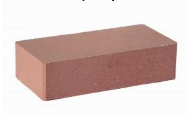
Красный кирпич Гладкий 250x120x65 мм. 336 шт. в поддоне

Ниже представлены разные цветовые решения, имеющие одинаковые технические характеристики: