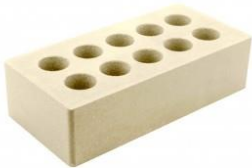
Слоновая кость Гладкий 250x120x65 мм. 336 шт. в поддоне