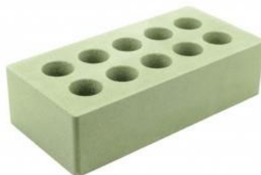
Зеленый кирпич Гладкий 250x120x65 мм. 336 шт. в поддоне