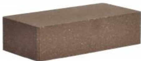
Коричневый кирпич Гладкий 250x120x65 мм. 336 шт. в поддоне