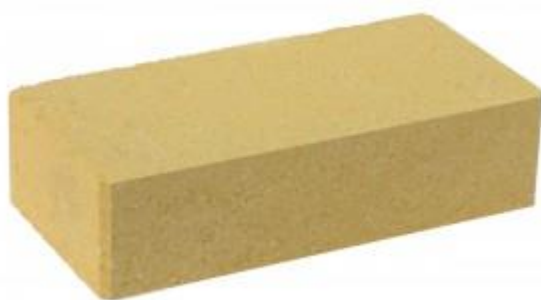
Желтый кирпич Гладкий 250x120x65 мм. 336 шт. в поддоне