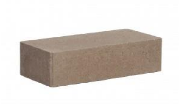
Молочный шоколад кирпич Гладкий 250x120x65 мм. 336 шт. в поддоне