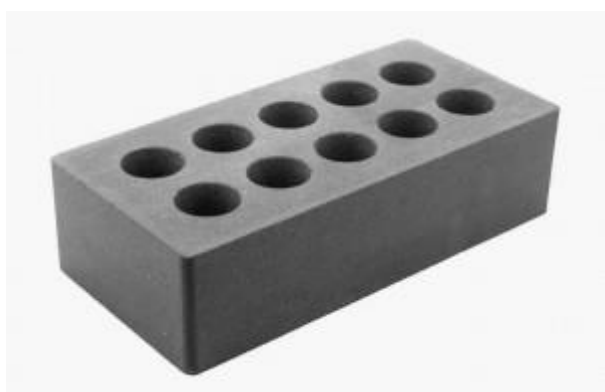
Черный кирпич Гладкий 250x120x65 мм. 336 шт. в поддоне